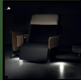
Light Package, Licht unter dem Bett, dazu 1 Stück externer Anschluss.

Grünes Modell: € 11,- Neues Modell: € 14,-