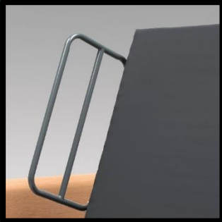
Seitenteile (Rückenlehne) wahlweise in Metall.

Grünes Modell: € 16,- Neues Modell: € 20,-