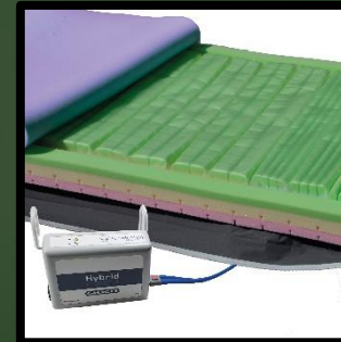
AirSleep Dekubitusmatratze in Breite 85 cm einschließlich Pumpe.

Grünes Modell: € 26,- Neues Modell: € 33,-