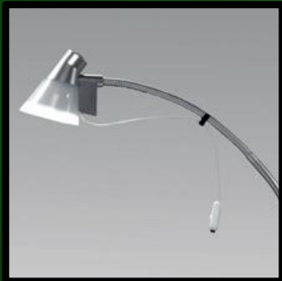
Bettlampe mit LED-Licht:

Grünes Modell: € 26,- Neues Modell: € 33,-