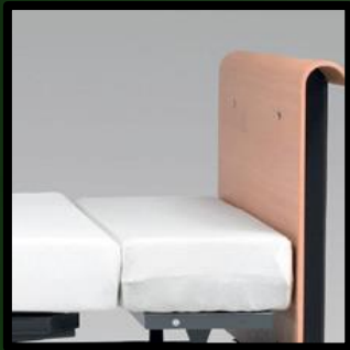
Bettlaken, Baumwolle: Preis pro Satz: € 59,-