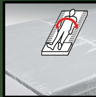
RotoSlide – Gleitauflage: Preis: € 299,-