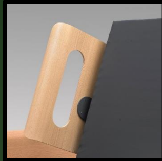
Seitenteile (Rückenlehne) wahlweise in Eichenfurnier.

Grünes Modell: € 16,- Neues Modell: € 20,-