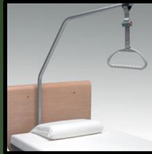
Aufrichter mit Trapezgriff einschließlich Aufrollgurt.

Grünes Modell: € 16,- Neues Modell: € 20,-