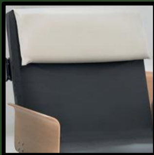
Kopfkissenhaltetasche: Preis: € 79,- Kopfkissen aus viskoelastischem Schaum, Breite 80 cm Preis: € 99,-