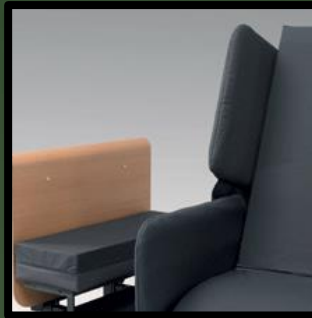
Polsterung für Metall- Seitenteile, waschbar bei 60 °c.: Preis 1 Stück: € 199,-